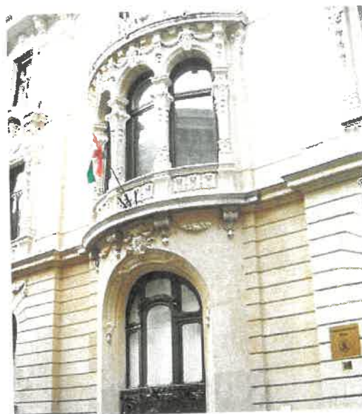
A TIT székháza a józsefvárosi Bródy Sándor utcában

hogy az élő szavas előadás manapság korszerűtlennek tűnik, de mégis azt mondom: érdemes ezt a gyakorlatot folytatni!