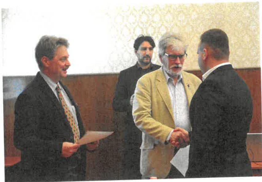
Díjátadás a Természet Világa diákpályázat mini-konferenciáján, 2023.