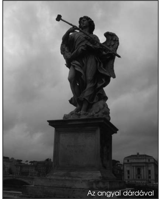
Az angyal dárdával

Akkor a Pietro Cossa utcából el is indulok, és egy-két perc után máris a Tevere (Tiberis) folyó partján találok magam, ahol egyből föltűnik a monumentális Palazzo di Giustizia (Igazságügyi Palota), amely vaskos méreteivel valami felségességet és örök érvényűt kíván közölni.