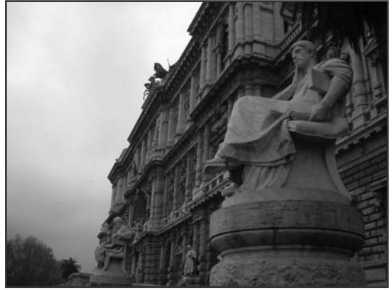
A palazzo di giustizia szemből, és oldalról

Jómagam, miután beléptem a 15. századi bronzajtókon (és figyelmesen megtekintettem Michelangelo Pietáját ), amit legjobban tapasztaltam, az az volt, hogy elvesztettem a tér- és idő-érzékeimet. Minden nagyon arányos volt, ha középen haladtam. Csak akkor éreztem igazán törpének magam, amikor megálltam egy oszlop mellett, amely akkora volt, mint egy tízemeletes panelház. Észre sem vettem, hogy amíg a főhajó egyik végétől a másikig elértem, addig súlyos percek teltek el. Nem is beszélve arról, hogy mennyire precízen van kivitelezve minden, szinte minden négyzetméter és minden falfelület ki van használva. Amikor távozóban voltam,