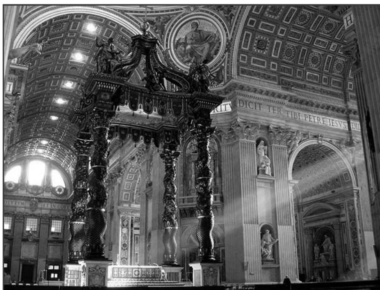
A Szent Péter bazilika belseje.

Pétert Nero cirkuszától nem messze temették el, akinek sírja fölé Constantinus császár emeltetett templomot 315-349 között. Az öt hosszhajóval és kereszthajóval rendelkező bazilika száztizennyolc méter hosszú volt, és előtte egy négyszögletes árkádos udvar volt, a korabeli bazilikák stílusának megfelelően. A népvándorlást követően gyakran kirabolták a templomot, de mindig érkezett utánpótlás a hívek és a pápák adományaiból. 1451-ben súlyos tűzvész pusztított Rómában, aminek következtében meg-