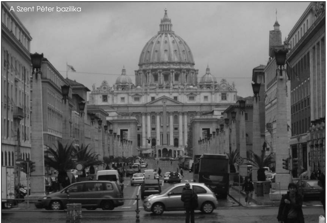
A Szent Péter bazilika

Miután 1870-ben Róma elfoglalásával egyesült Olaszország, el akarták határolni magukat a Szentszék önkényétől. Ezért is található sok régi