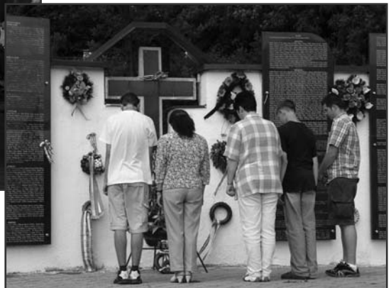
A Szolyvai Emlékpark (Kárpátalja)