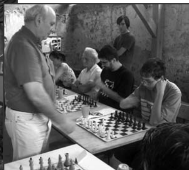
Sakksétatér Öcsön, a Művészetek Völgyében