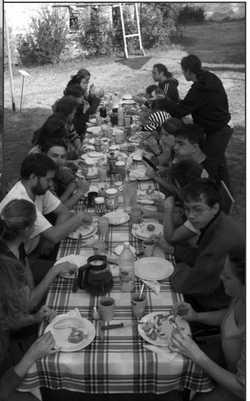
Reggeli Öcsön, a Sakszétatér helyszínén