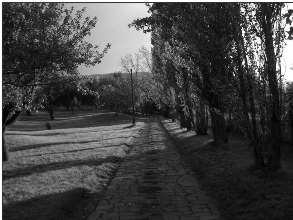
A „Sion hegyére” vezető út Tahiban

Fogta a kezemet, úgy vezetett. Most már nem hiszi, hogy beteg vagyok. Rajzoltam nekik sokmindent, talán megtetszettek neki a rajzaim. De most már mindegy, mert eltűnt, hazautazott. Az egész csak egy hétig tartott. Én pedig várok – ismét csak arra, hogy bejussak a nagy házba.