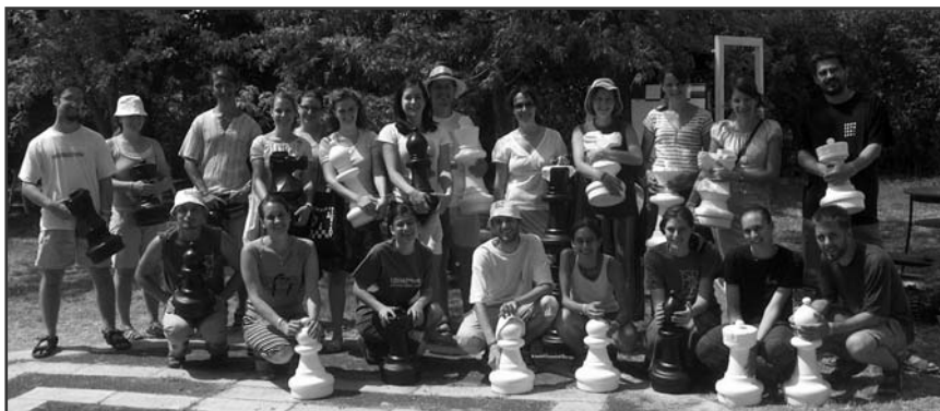
A Sakksétatér stábjába a Csillagpont találkozó.

Sokszoros válságtünetekkel küszködő nemzetünk számára ezért fontos, hogy megerősödjünk lelkünk szilárdságában, hitünkben, valós eredettudatunk megtartó erejében, teljes nemzettudatunkban. Bátorítson mindannyiunkat, hogy „ mindenütt nyomorgattatunk, de meg nem szorítottatunk; kétségkedünk, de nem esünk kétségbe; üldöztetünk, de el nem hagyatunk; tiportatunk, de el nem veszünk. “ (IX.)