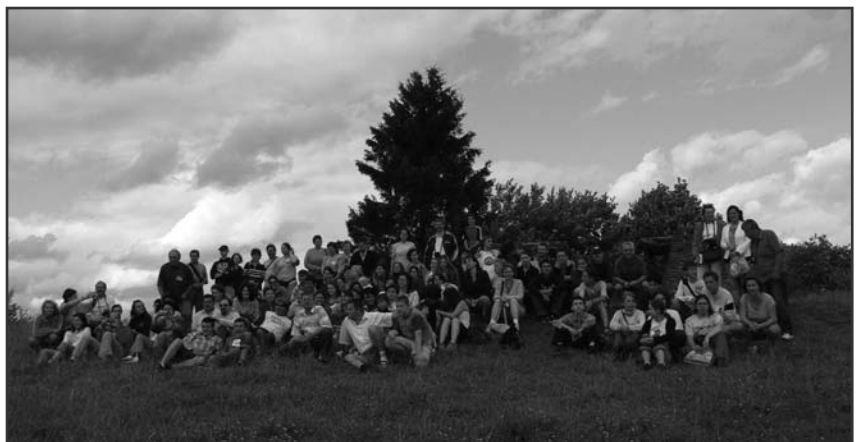
XII. Magyar Református Középiskolák Kárpát-medencei találkozója