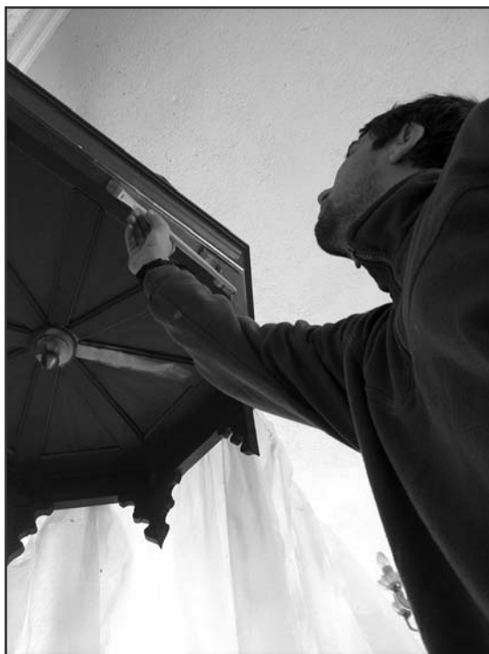
Belső munkálatok a radnai templomban

Másodszorra csak üres szobát találtam. Ő már elment, elköltözött abba a világba, ahol többé senki sem „pisis vénember“ vagy „professzor úr“, csak ennyi: „Jó és Hű Szolga.“