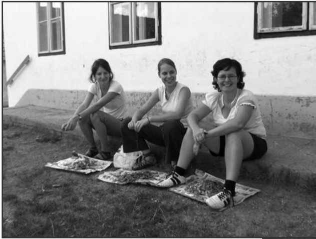
Vidám segítők az ebéd előkészületeinél a Gólyatáborban Szokolyán.

Ő az Atyáé. Visszatért Szín az élők közé.