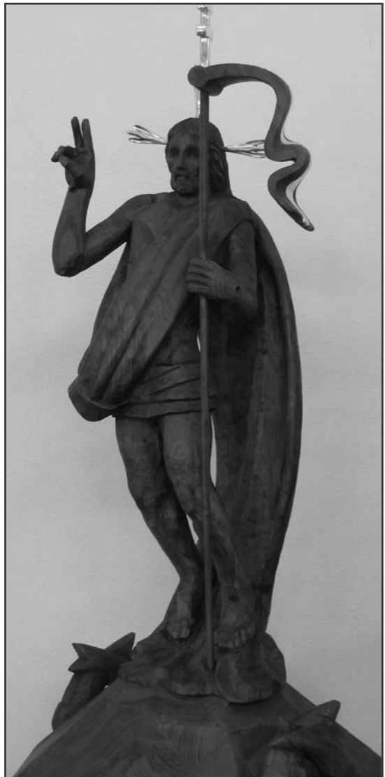
Baracza Szabolcs: Feltámadt Krisztus

Egy régi húsvét fényénél borongott S vigasztalódott sok tűnt nemzedék, Én dalt jövődő húsvétjára zsongok És neki szánok lombot és zenét. E zene túlzeng majd minden harangot S betölt e Húsvét majd minden reményt. Addig zöld ágban és piros virágban Hirdesd világ, hogy új föltámadás van! (Juhász Gyula, Húsvétra)