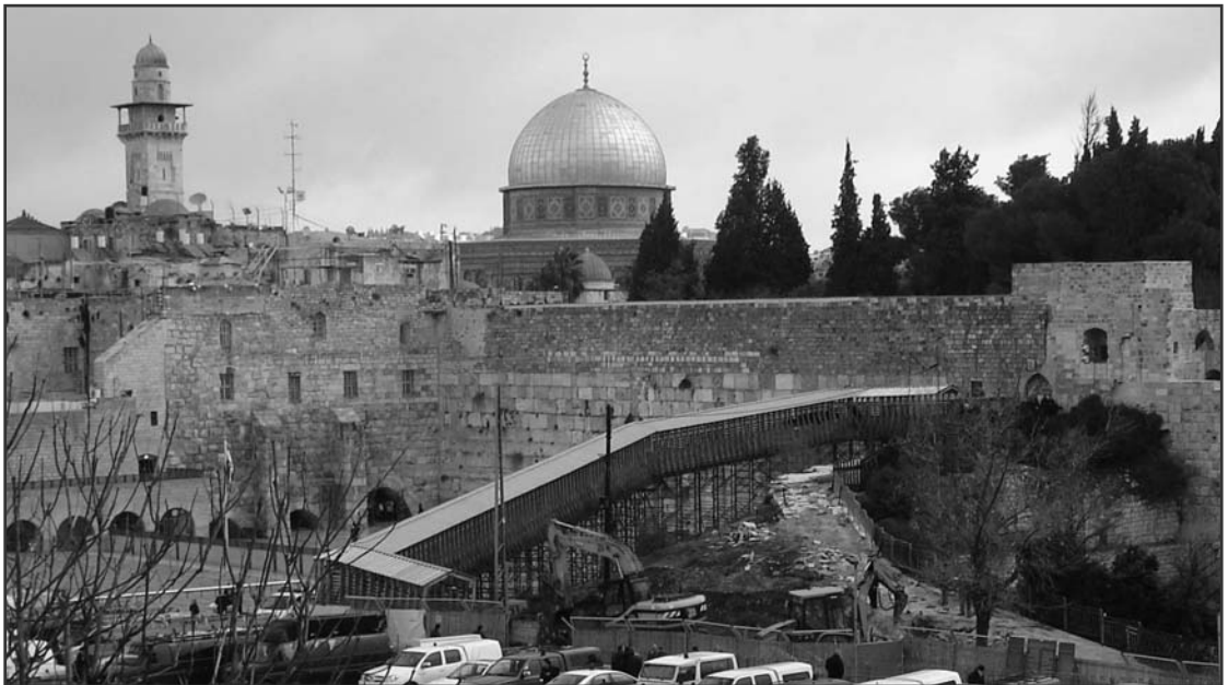
Az újabb konfliktust kiváltó rámpa (Jeruzsálem, Templomhegy)

Ma már csak egyetlen miniszter mentheti meg a magyar nemzetet. Ez pedig a minister verbi Dei: Isten Igéjének szolgája. Senkire sem mutogathatunk. Nagy kegyelem, hogy az Ige révén még új történet nyílhat meg nemzetünk számára. Ugyanakkor nagy felelősség is nehezedik a vállunkra: mert épp ennek az Igének hathatós hirdetésébe von be minket munkatársaiként az Úr, az őrálló és az apostol felelősségét helyezve a református teológusok vállaira. Ámósz és Paulus példája erősítsen mindannyiunkat az önpusztítás és a barbárság korában.