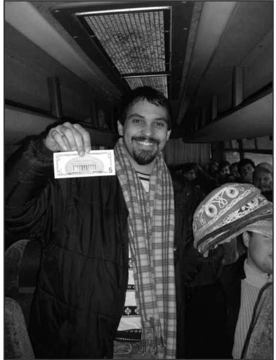
Minden egy dollár! (All is one dollar)

Másnap reggel az Olajfák hegyére kirándultunk, és onnan gyönyörködtünk Jeruzsálem látképében. Végre a nap is kisütött, így a város legszebb arcát mutatta nekünk. Először a Dominus Flevit kápolnához mentünk. Ezt