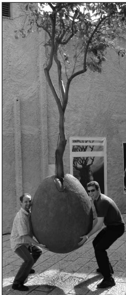
A művészet ereje Tel-Avivban

Néhány percig csönd van még odakint. A napfény lassan feloldja a hangulatot. Nem maradt ott Krisztus a sírban. Mellettünk van az Olajfák hegye a maga egyszerűségében és szépségében. Nincs nagy katedrális, de innen emelkedett a mennybe a Feltámadott. És ide fog visszatérni is, és az egész világ látni fogja. Jövel, Uram, Jézus!