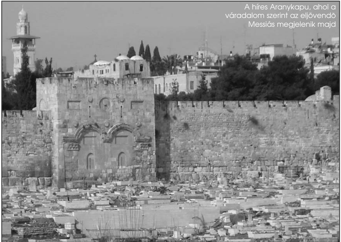
A híres Aranykapu, ahol a váradalom szerint az eljövendő Messiás megjelenik majd