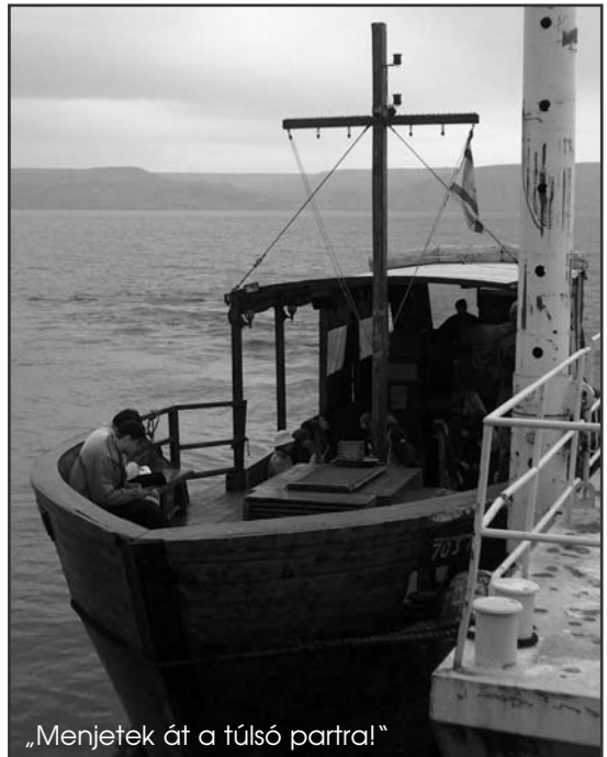
„Menjetek át a túlsó partra!”

számított, mert korommá lett a levegő. A fény is siratott valakit, aki egykor ott feküdt. Csak az apró hitem világított. Fényképeztem, vilant a vaku, s egy pillanatra láttam, mi van szemmel nézve abban a barlangban. De igazán nem a szűk hely lett fontossá, hanem a bennem gyülekező érzés. Megvagy még? – kérdezték kintről. Igen. Most lettem meg. Három napot maradtam volna bent, de éreztem, nem egyedül. Ott megszűnt a lét szárnalmas formája, s a romlandóság, a zúrók, a zsványság helyett dicsőség, és mérhetetlen csönd áradt. Hallgatott, miképp a sír, de a legtöbbet mondta. Kijöttem. Kijönni más volt, ám már tudtam: egyszer kijövök onnan romolhatatlanságban, és lélekadta dicsőségben is. Ott volt. Nem tudtam megszólalni. A sír után mentem a Golgotára. Köszönöm Neked, ki elvette a világ bűneit – rogytam térdre. A Lélektől megittasulva az első kápolnában, mely nyugalmas sarok volt, újra megalázkodtam. Órákat imádkoztam egy perc alatt, mert nem lehetett tovább. Menni kellett. Ki a világba. És ma is megyek. Viszem a világba, ami bent volt, ami bennem van. Ez az életem. Te, Uram.