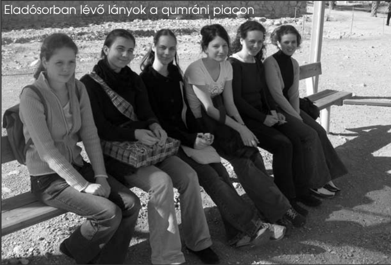
Eladósorban lévő lányok a qumráni piacon