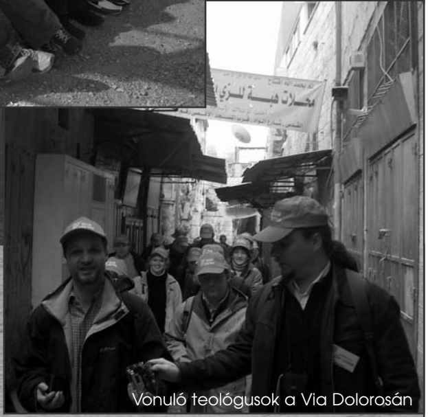
Vonuló teológusok a Via Dolorosán