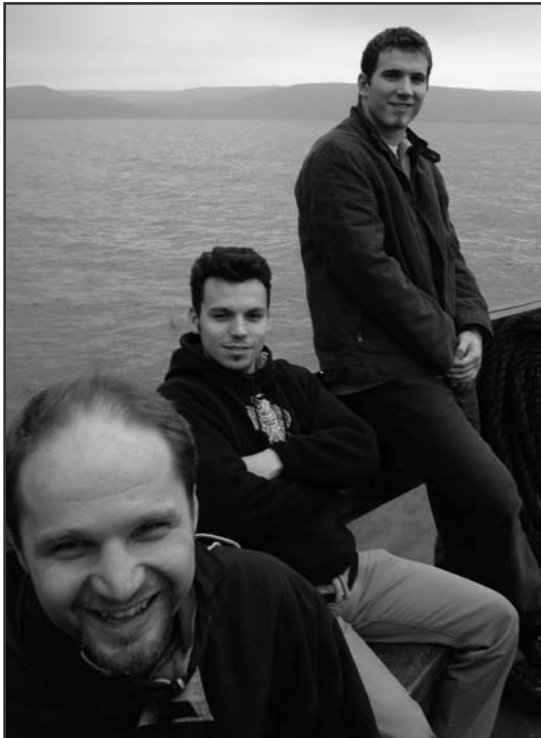
Mai tanítványok a Genezáret tavon

Ez az utazás mindannyiunknak páratlan és maradandó élmény volt. Szívvel köszönjük a Dunamelléki Egyházkerületnek és a Károli Gáspár Református Egyetemennek az utunkhoz nyújtott támogatását és segítségét. A mi Urunknak legyezen mindezzért hála!