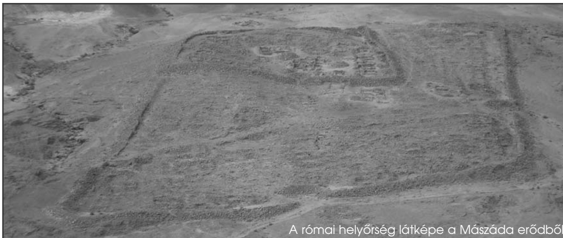
A római helyőrség látképe a Mászáda erődből

A zsidó védők halála után ismét egy római csapat telepedett meg egy időre az erődítményben. Mászáda utolsó lakói bizánci szerzetesek voltak az V. és a VI. században. Kis cellákban és barlangokban éltek, csak egy kápolnát építettek maguknak mozaik padlózat- tal. Feltehetőleg a perzsák vagy a mohamedánok támadása miatt kellett távozniuk a VII. század elején. Attól az időtől kezdve Mászáda lakatlan.