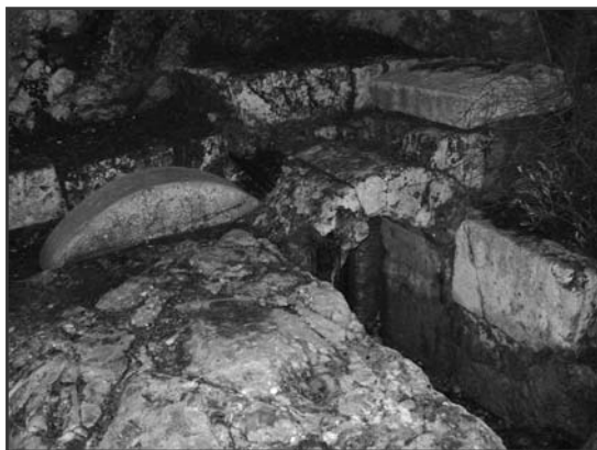
Egy Jézus korabeli sír

- Mikor Izraelről meséltem, – nemcsak otthon – az elején mindig elmondtam, mennyire csodálatos volt a Genezáret-tó. Amikor a fából