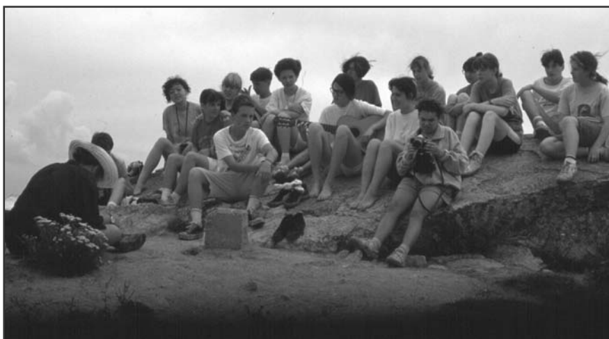
Áhítat a sziklán

Nagykőrös kis város, mindenképpen behatólt lehetőségekkel, viszont ennek annyi előnye van, hogy a diákok szabadidejükben is egymásra vannak utalva, úgyhogy a kollégiumi élet továbbra is színes. Családias a légkör. Ez igazán olyan unikum, ami tényleg nincs több az országban.