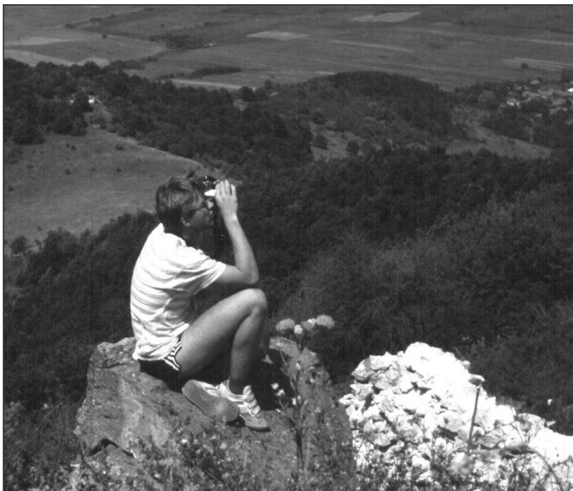
Az ég titkait fürkészve

Jó lenne kíméletlen becsületességgel megvizsgálni és nem mindjárt azt mondani: persze, konfirmáción is volt erről szó. Sokszor van erről szó, de be van-e írva a szívünk hűstáblájára – ahogy olvastuk most a Bibliában. Mert ha ez be van írva, akkor lesz az életünk olyan hitelesítő levél, amelyik szavak nélkül is beszél másoknak Jézusról, és akkor lesz erőnk az élet kényes helyzeteiben is megmaradni Jézus tanítványának, és olyan módon cselekedni, ahogy azt ő mondja.