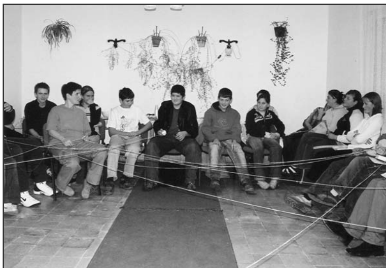
A hálózat épül. Teológus nap Soponyán.

„Bölcsé teszek, és megtanítalak, melyik úton kell járnod. Tanácsot adok, rajtad lesz a szemem.” Zsolt. 32,8.