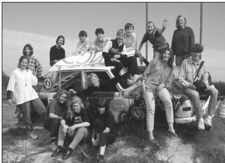
Fiatalság: összetartó erő