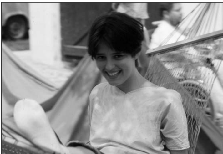
A jövő mosolya

Új ötletként októberben a filmklub lehetősége merült fel, amelyet plakátokon is hirdettünk, a Diakónia épületében tartjuk, talán oda inkább eljönnek, mint a templom mellé – és talán ez nagyobb érdeklődést kelt, mint egy hagyományos ifióra. Rengeteg fiatal van a faluban, és mivel közel vagyunk Budapesthez, egyre többen költöznek le, így megvan a helye az ifjúsági munkának. Nehézség az, hogy nem nagyon ismerjük őket, ezért egy-két hónapja majdnem minden hétvégén kimentem, hogy próbáljak beszélgetni, ismerkedni velük,