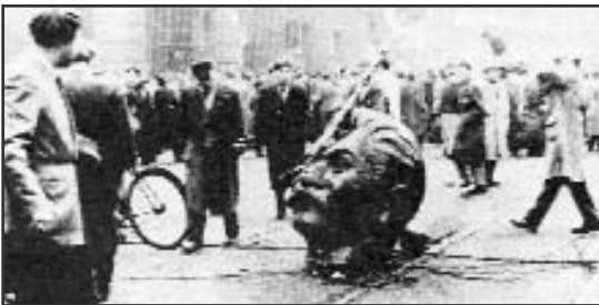
A forradalom jelképe: a ledöntött Sztálin szobor

Nem elég – a Világért! Több kell: – a nemzetért! Nem elég – a Hazáért! Több kell most: – népedért! Nem elég – Igazságért! – Küzdj azok igazáért, kiké a szabadság rég, csak nem látják még, hogymég nem elég! Még nem elég! (1959)