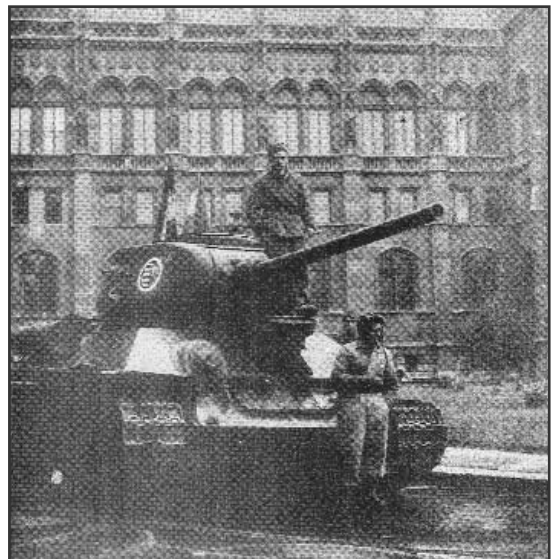
Magyar harckocsi a Parlament előtt A Corvin köz csata után