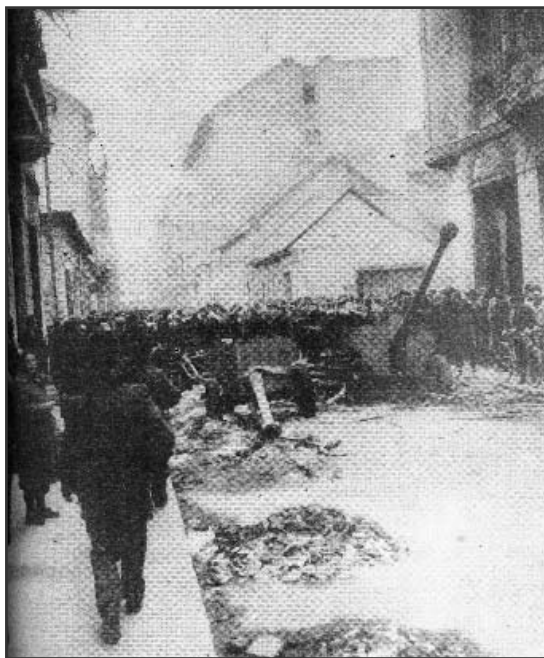
Páncéltörő ágyuk a Práter utcában

A kápolnában minden hónap utolsó vasárnapján és minden egyházi és nemzeti ünnepeken tartanak szentmisét 16 órakor.